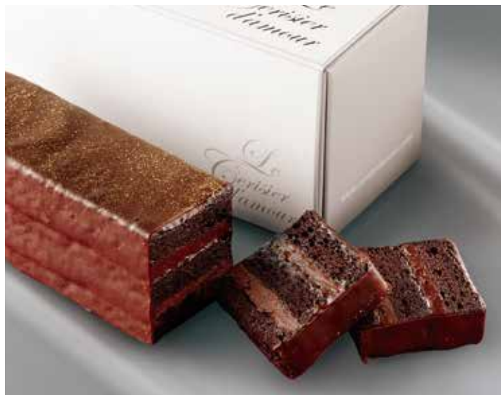
ショコラロワ 限定販売 常温 賞味期限/2週間

ハートの形がキュート。濃厚なガナッシュと、くるみがたっぷり入ったしっとりスポンジが層になっており、味と食感の違いも楽しめます。チョコレートと香ばしいくるみのほろ苦さが大人味。贈り物にもぴったりです。