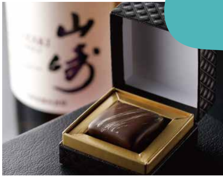
プレミアムBOX 限定販売 常温

ミルクチョコ、ビターチョコ、甘酸っぱいベリー、まろやかなホワイトチョコを組み合わせて作り上げた、お子様も食べやすいスティック付きの可愛らしいチョコレートです。