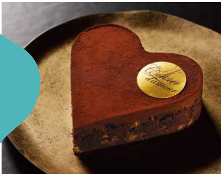
ブラウニー 限定販売 常温 賞味期限/2週間

世界が認めたウイスキー「山崎」と、フランス ヴァローナ社の高級ミルクチョコレートで作り上げた、素材にこだわった贅沢な一品です。