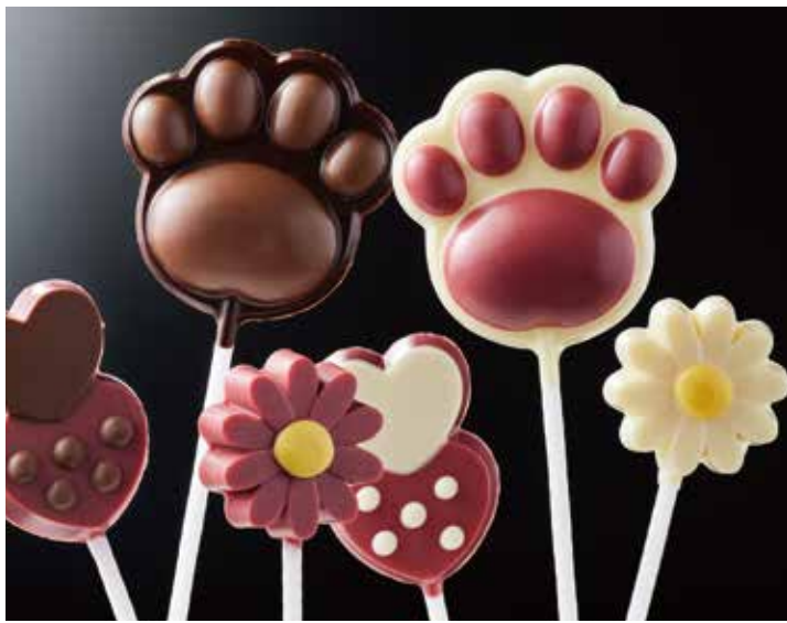
スティックチョコ 限定販売 常温

ル・スリジェダムールこだわりの生ケーキや、チョコレート菓子も 多数ご用意いたしております。